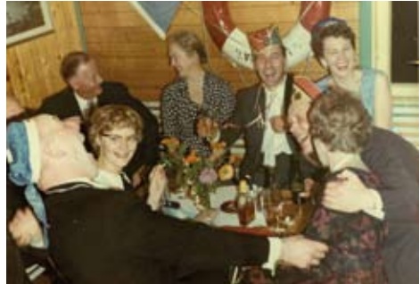
Joda - de festet på den tiden også.