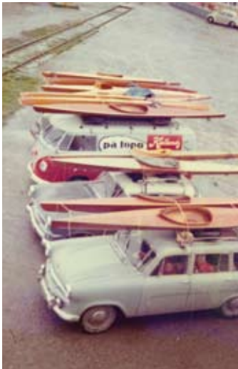
KUL på tur.