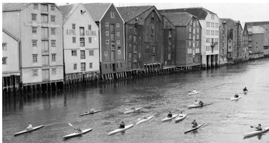
De padlet i Nidelva den gang også.

Trykk: Skipnes as Lay-out: Synlig design og foto as Redaktør: Anne-Lise Aakervik Forsidefoto: fra Terje Wesches fotoalbum