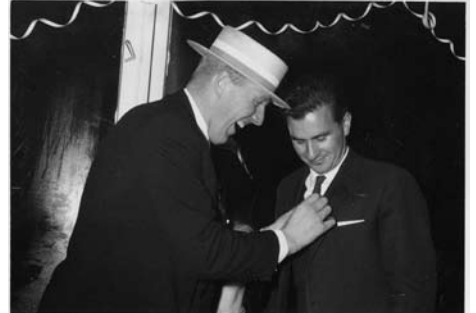
Krabbeklo til den utvalgte.