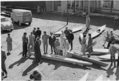
Vårpuss ved klubbhuset