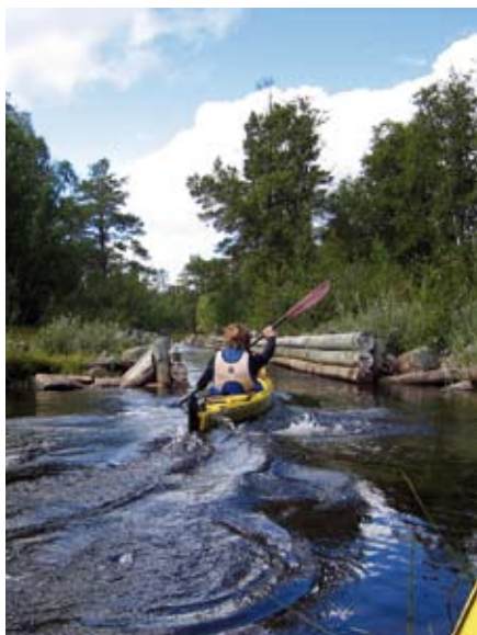
Magnus i tømmerenna