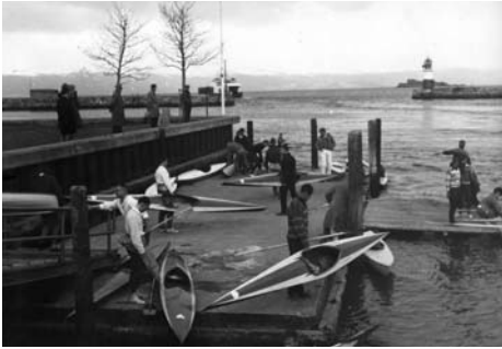
Samme brygge - samme holme