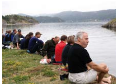
Lunsj på øy

Flere forslag til neste kultur og kajakkstur ble diskutert. Stiklestadspelet, «Det brenn ein eld» på Røros, Storåsfestivalen - ikke alle friluftsscener er tilgjengelig for friluftsfolk som kommer sjøveien. Kanskje «Den siste viking» på Stadsbygd? Vi ser for oss at kajakkklubben entrer forestillinga fra sjøsida. Opp elveløpet og inn på arenaen. Sjølsagt i tidsriktige kostymer. Vel, vi har ikke diskutert dette med regissøren. Det er muligens klokt av kajakkklubben å fokusere på utfordringa det blir å krysse Trondheimsfjorden.