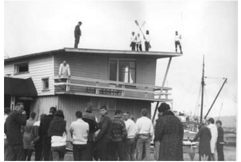
Avplask 1. mai - stilfullt.