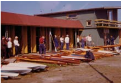
Våren er her - klargjøring av kajaker

Se flere bilder på tkk.no