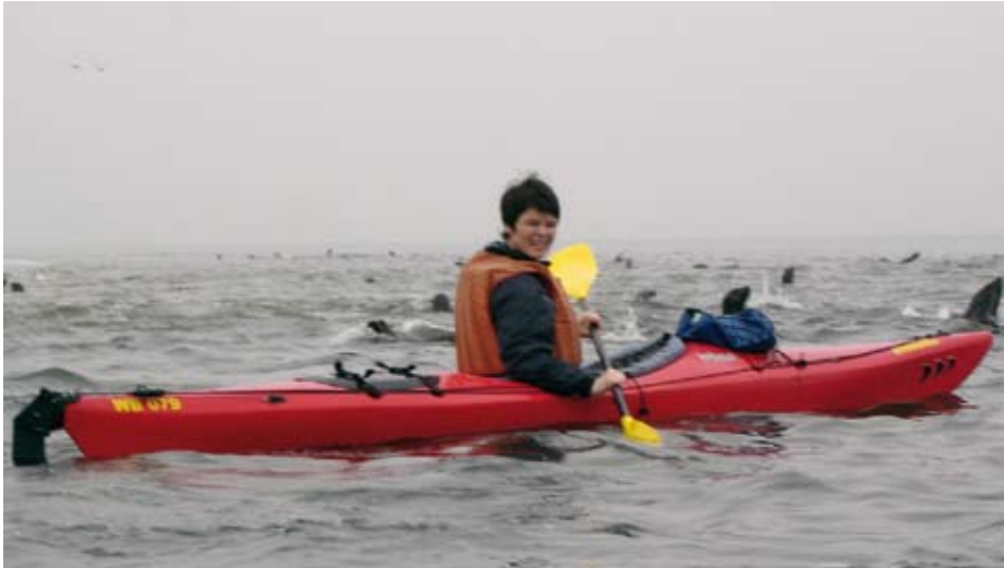
Med kajakk blant hundrevis av seler

fram padleåra. Vi er jo på aktivitetsferie. Tidlig en morgen setter vi oss derfor i kajakkene. Dette er ingen ekstremtur altså, oppakkingen består av hver vår vannflaske, vi skal bare rundt svingen.