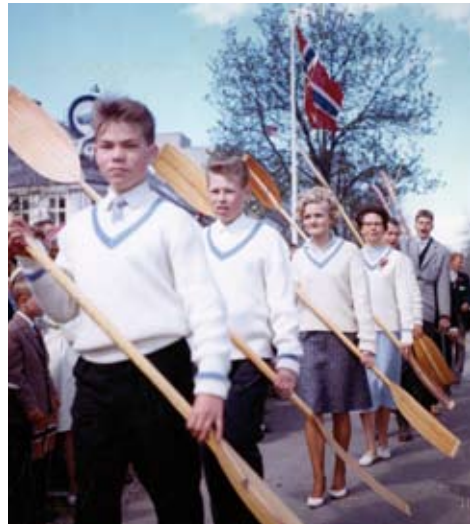
TKK i borgertoget 17. mai.