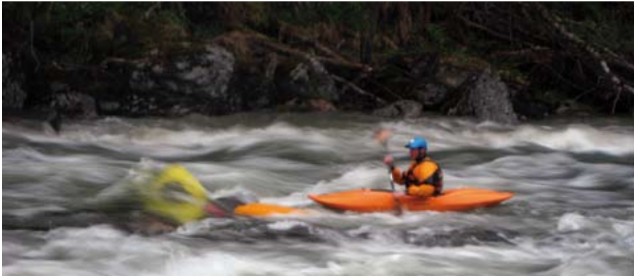
Fleming redder båten til Elin.