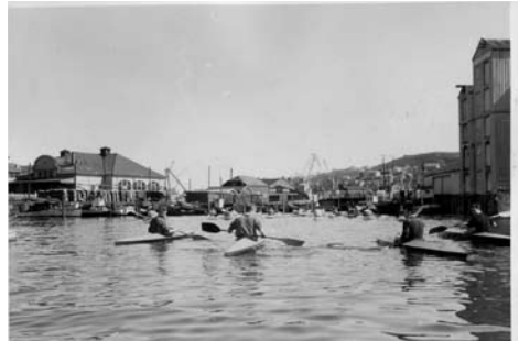
Kanalen god å ha, da som nå.