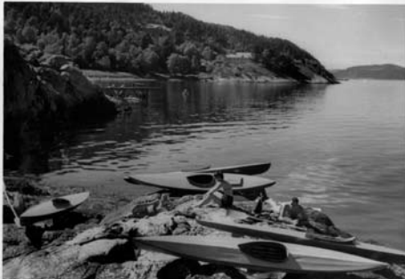
Sol i Brennebukta