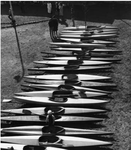
Optelling etter vinteren