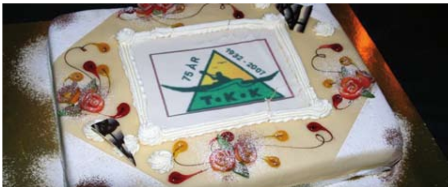
Den flott jubileumskaken.