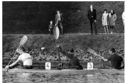
Konkurransepadling fra klubbens konkurransedager.