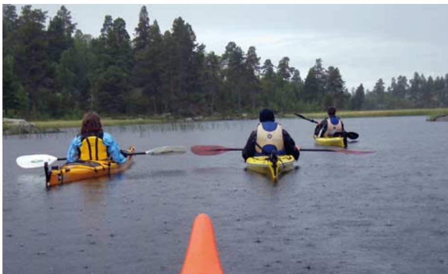
Femunden i regn.