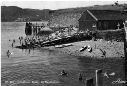
Badeliv ved Munkholmen