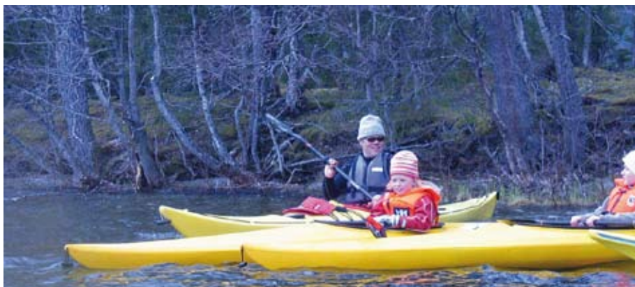
Jonsvannet en vårdag i 2007.

Sesongen startet tradisjonen tro med avplask på "Jonshavet" 6. mai. 11 juniorer og 8 seniorer møttes i vårsola på Jonsborg til et hyggelig gjensyn med gamle kjente og nye fjes. Jonshavet lå blankt og innbydende og turen gikk som planlagt til Grillodden hvor det var tid for lek og grilling. Godt oppmøte og flere nye turkamerater lovet godt for sommerens aktiviteter.