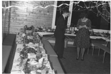
Festkomiteen foretar siste justeringer