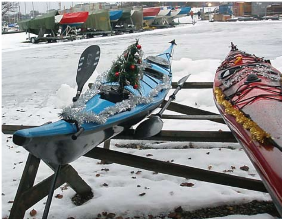
Juletreets naturlige omgivelser er PÅ LAND.

Skuffelsen ble imidlertid stor. Årets festkomité hadde en litt annen tilnærming til oppgaven enn hva som hadde vært tilfellet året før.