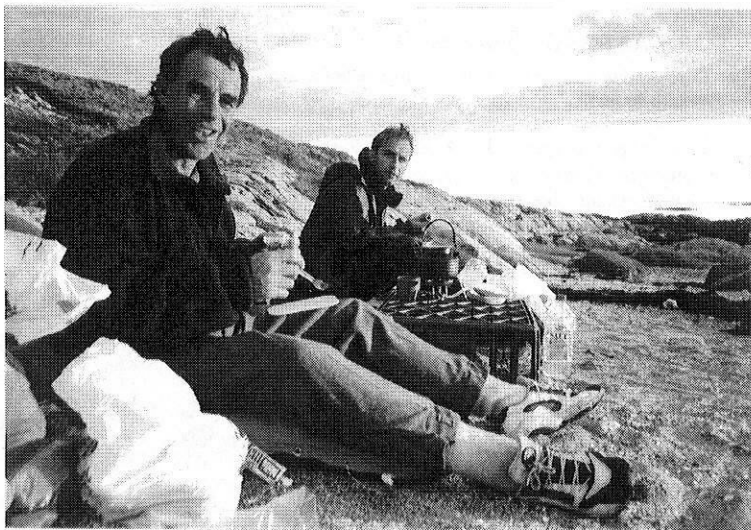
To andre «herlige» menn slapper av etter en flott dag med padling langs Trøndelagskysten